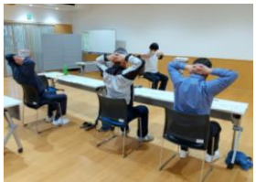
昨年度の研修の様子

地域の皆さまが介護予防事業に関り、自助・互助を進めていくことを目的として「阿木いきいきリハビリ体操指導士」の養成を行っています。詳細は来月の広報と一緒に配布予定です。ホームページなどにも掲載しますのでぜひご確認ください。