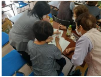
▲どの調味料が上位にくるのか、グループに分かれて相談しました