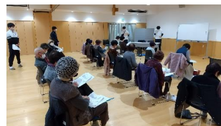
▲1月開催 「フレイル予防」理学療法士