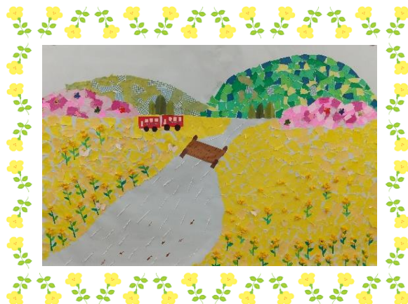
▲素敵な作品ができあがりました。

今回もグループホームにちぎり絵をプレゼントしていただきました。 明るい春の絵です。