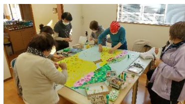
◀▶ 和気あいあいと皆さんで作業。

今回もグループホームにちぎり絵をプレゼントしていただきました。 明るい春の絵です。