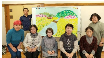
◀ あぎ生活・介護サポーターの皆さん

あぎ生活・介護支援サポーターの皆さんは、地域で様々なボランティア活動をしています。コロナ禍で休止していた地域や施設でのボランティア活動を現在、徐々に再開しています。