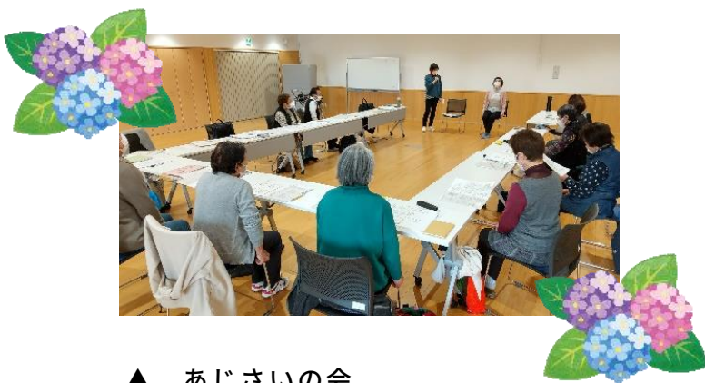
▲ あじさいの会 定例会の様子皆さん真剣です