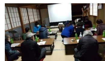
▲山野田 減塩講座の様子

中の島キッチンクラブでは、介護予防に楽しく取り組み、達成感を味わうことを大切にしています。3月には手打ち蕎麦をしました！料理は頭を使うので、認知症予防にもおすすめです。一緒に取り組みませんか？参加者大募集中です！！