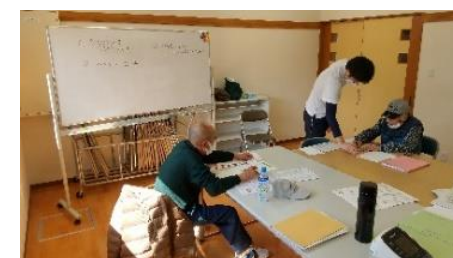
▲サービス利用時の様子