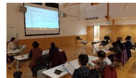
▲2月開催 「転倒は健康寿命に左右する」薬剤師