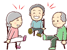
▲ あじさいの会のみなさんによる演習の様子