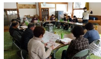
▲飯沼での教室の様子